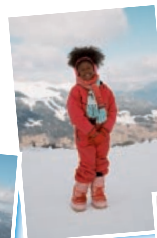
Manon elle, cherche sa place et son identité et veut se fondre dans le milieu ambiant, cest-à-dire le monde blanc.